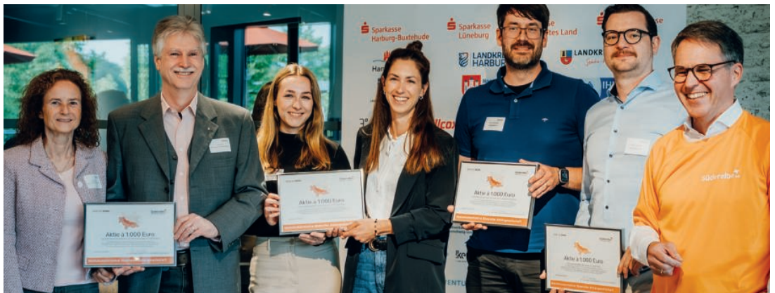
SEEVETALER WARENHOTEL, MINA MARKETING, LINSENSPEKTRUM, IKEN DESIGN

„Als wachsendes Start-up im Bereich Marketing und Design schätzen wir digitale Vernetzung – doch echte Beziehungen entstehen vor allem im persönlichen Austausch. Durch das Netzwerk der Süderelbe AG möchten wir uns regional vernetzen, spannende Süderheld:innen kennenlernen und zur Branchenvielfalt beitragen. Die Süderhelden stehen für Kooperation und die Stärkung der regionalen Wirtschaft – genau das, was uns antreibt.“