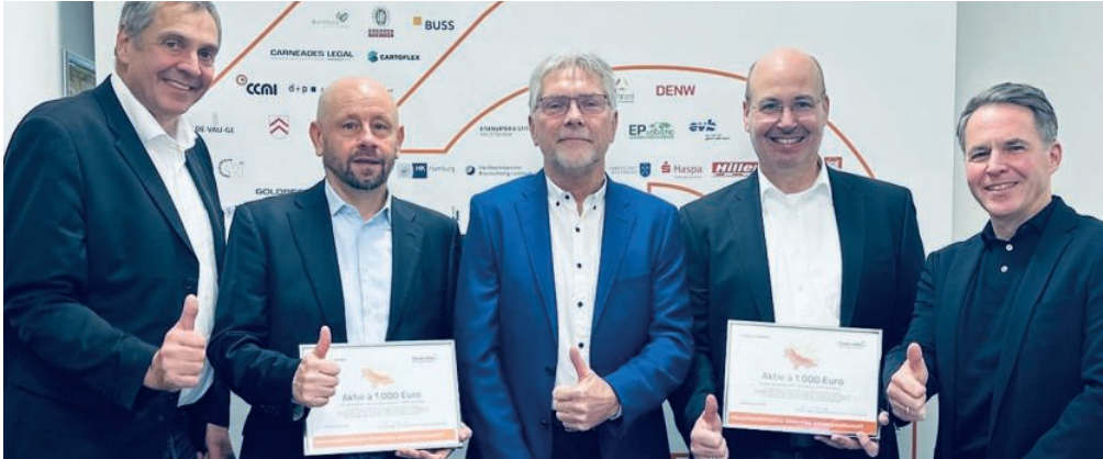
BREMER HAMBURG, DAS HR BUREAU®